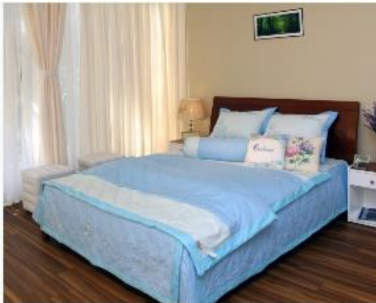
Bộ cao cấp màu thêu phủ