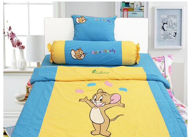
Bộ Chăn - Drap - Gối xốp thêu